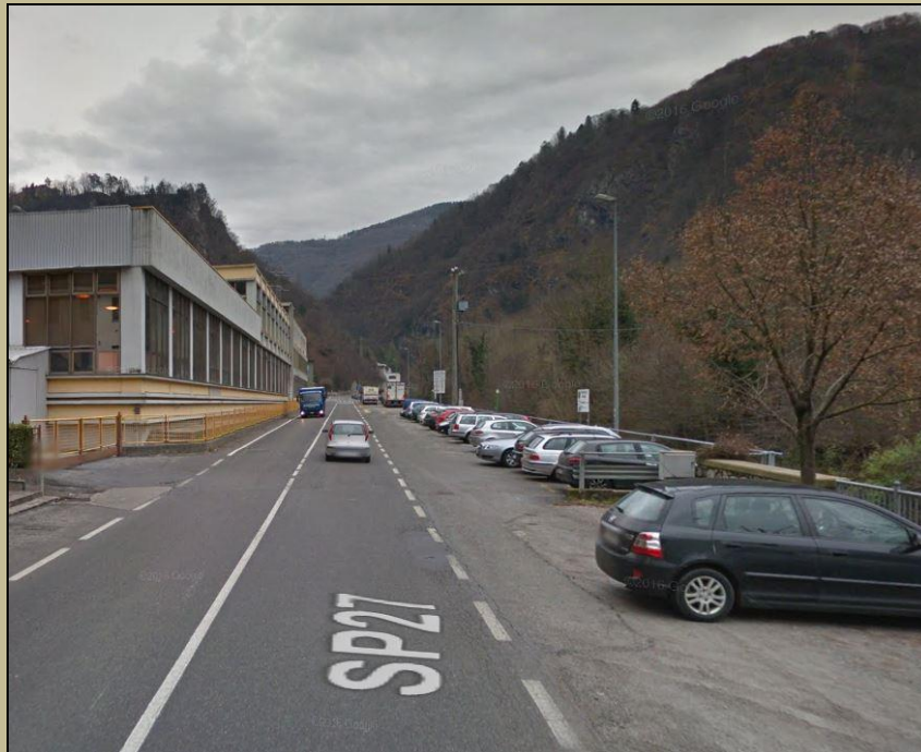
FOTO 2: SABATO 23 GIUGNO 2018, PUNTO DI RITROVO DELLA CAROVANA "STABILIMENTO FONTE BRACCA" 45.8084177, 9.6831087 , CIRCA 500 METRI DOPO IL BIVIO