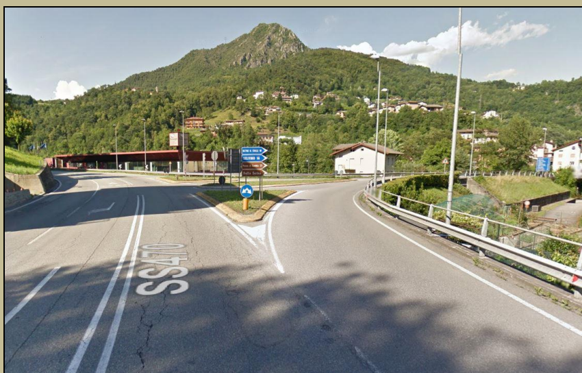
FOTO 1: SABATO 23 GIUGNO 2018, VERSO IL PUNTO DI RITROVO DELLA CAROVANA DA ZOGNO SS470, BIVIO 45.807489, 9.677914 PER IL PUNTO DI RAGGRUPPAMENTO: GIRARE A DESTRA